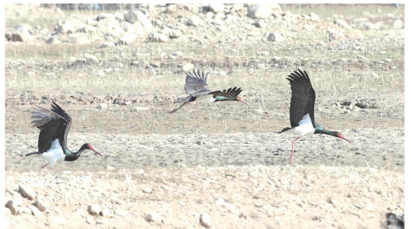
观鸟人士在郧阳区安阳镇拍摄的黑鹳觅食情景。

近两年,市民在丹江口库区和鄖阳湖国家湿地公园均发现黑鹳的身影。据介绍,这些黑鹳是来十堰越冬的。十堰市生态环境优美,已成为黑鹳、中华秋沙鸭等珍稀濒危水鸟越冬的重要区域之一。