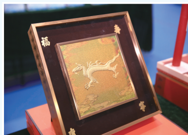
精美的金龙装饰画。

市教育局强调,各义务教育学校要落实好教育部“双减”相关政策,加强寒假期间作业管理,严禁学校以各种理由利用寒假期间组织集体补课或上课,保障学生的身心健康。