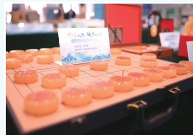
米黄玉制作的象棋。