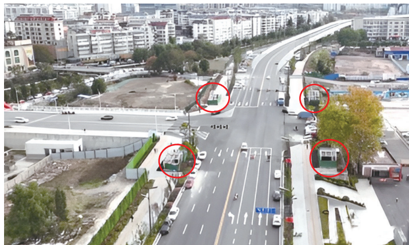
朝阳南路4号地下通道4个出入口(红圈处)正在进行内部装修。

朝阳南路两处地下通道投入使用后，将为市民营造安全便捷的通行环境，并且有助于提升朝阳南路来往车辆的通行效率。