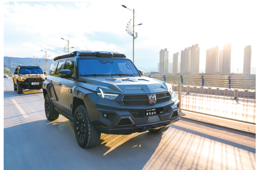
东风猛士 M800 星际战车将作为主力车型展示风采。(资料图片)