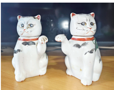
传承四代人的小猫存钱罐。