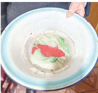
打满补丁的搪瓷盆成了老人思念爱人的情感寄托。