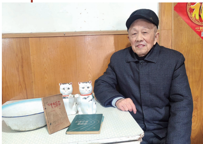
4件老物件承载着王大爷难忘的岁月。