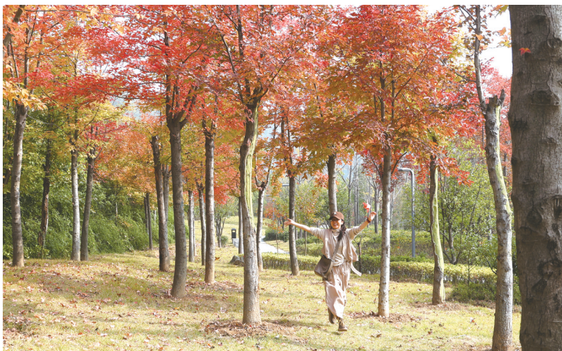
发展大道西段叶湾隧道出口旁的绿地里,枫叶红似火。

采访中,记者切实感受到落叶缓扫给我市带来的变化。它不仅仅是一种城市管理方式的改变,更是一种城市文化和精神的体现。落叶缓扫,让我们看到城市管理者在追求城市发展的同时,也在关注人们内心的需求。它让城市变得更加美丽,也更有温情。不仅仅是落叶,城市走向高质量发展,某种程度上也考验着管理者对城市生活美学的塑造水平。相信在未来,随着城市管理水平的不断提高,我市将会在生态与人文的和谐共生中绽放出更加绚丽的光彩,让这座城市成为人们心中更加美好的家园。