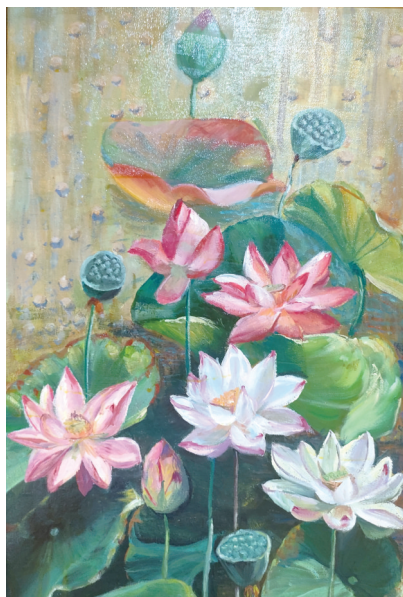
油画:《荷花》 作者:骆安平