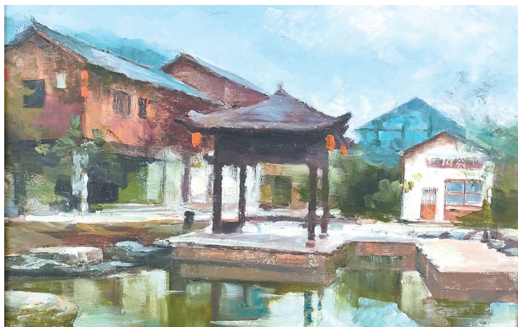
油画:《善水街写生》 作者:包元臻