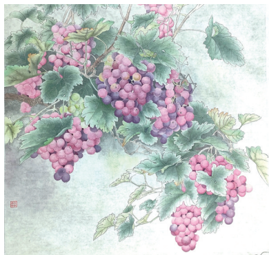
油画:《葡萄》 作者:白淑敏