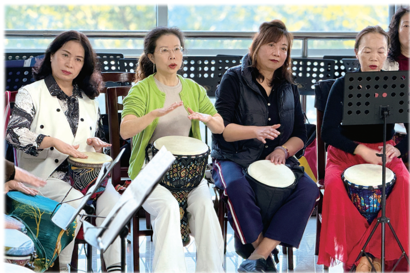
学员们相互配合,敲打非洲鼓演奏。