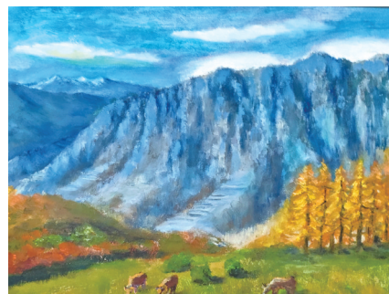
油画:《川西风光》 作者:徐宇健