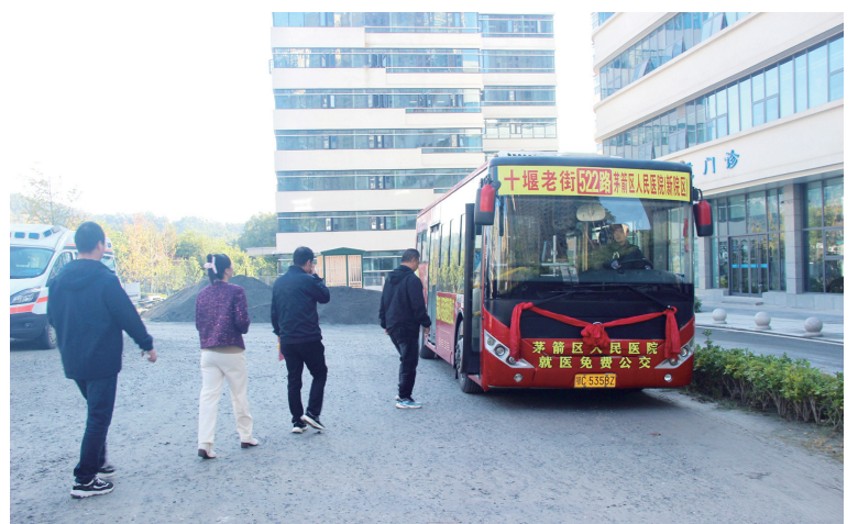
昨日,就医免费公交522路试运行,乘客有序乘车。