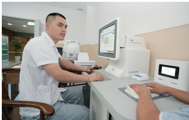
武当中医治未病中心利用“中医CT”辨识体系治未病。