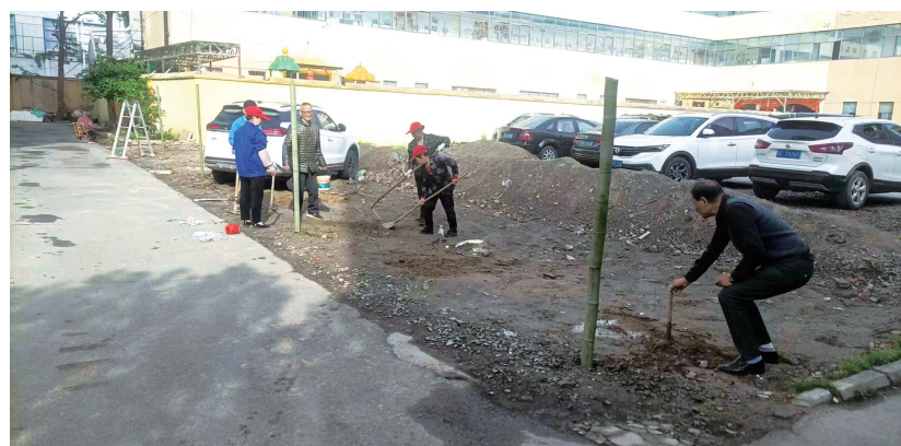
该小区物业公司工作人员在小区内补栽15颗雪松。

针对该小区物业公司的行为,茅箭区综合行政执法局(原茅箭区城市管理执法局)依据相关规定,对该物业公司作出补栽15棵雪松,并处罚款1000元的行政处罚。该物业公司对处罚结果表示认可。