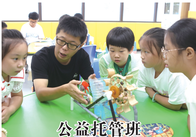
公益托管班 孩子有“趣”处