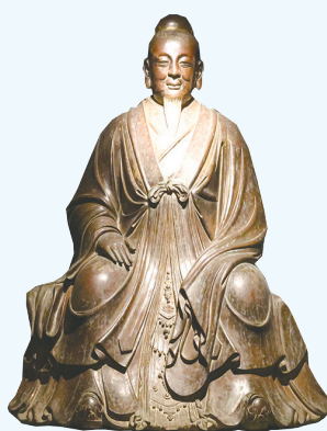
铜鎏金张三丰坐像