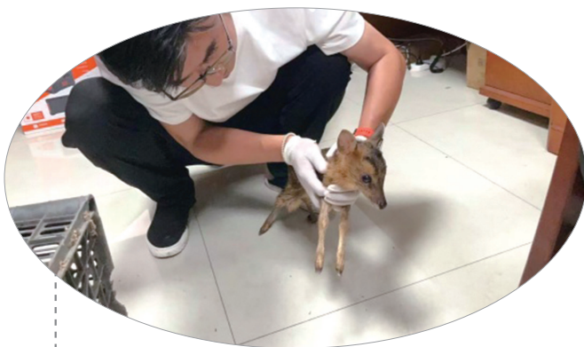
受伤的小麂幼崽得到了救助。

小麂是鹿科鹿属动物,别名角鹿、黄鹿、黄猯等,是鹿类中最小的一种,也是中国特有种类。小麂胆怯,听觉敏锐,清晨和傍晚活动最为频繁,喜欢栖息在茂密的灌木丛中,能巧妙地隐藏自己而得到保护,取食多种灌木和草本植物的枝叶、幼芽,保护区各地均有分布。