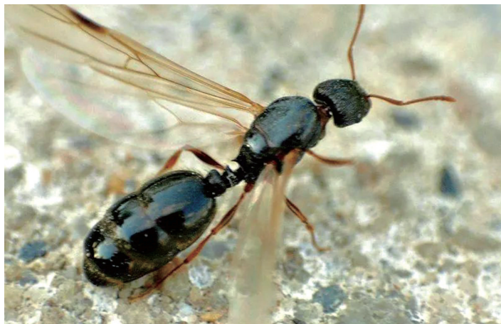
这种飞蚂蚁具有趋光性。

近日,家住国瑞中心小区的小吴向十堰晚报秦楚网新闻热线 8110110 反映,最近只要浴室灯一打开,家里就会出现很多带翅膀的蚂蚁,担心这些飞蚂蚁会咬人,但是又不知该怎么处理,这让她十分头疼。 ■文、图/记者 秦洪涛