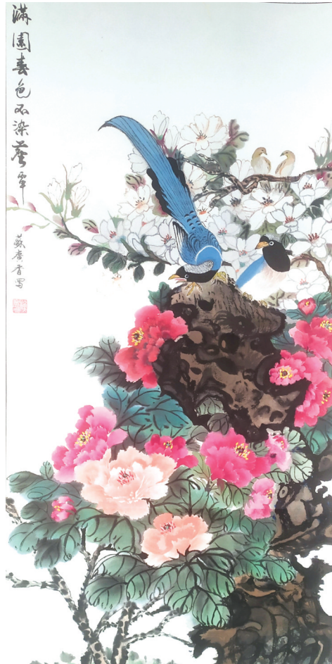
国画:《满园春色》 作者:苏广香