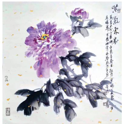
国画:《紫气东来》 作者:王富强