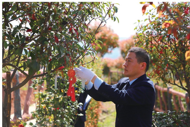
工作人员在逝者集体树葬的树上绑祈福带。

该工作人员表示,改变观念需要一个过程,节地生态葬作为一种绿色、生态、环保、文明的殡葬方式,既可以绿化荒山,改善美化生态环境,也能节省土地资源和殡葬开支,有利于逝者与自然和谐相处。随着人们观念的转变,将会有越来越多的人接受树葬等各种生态安葬方式。