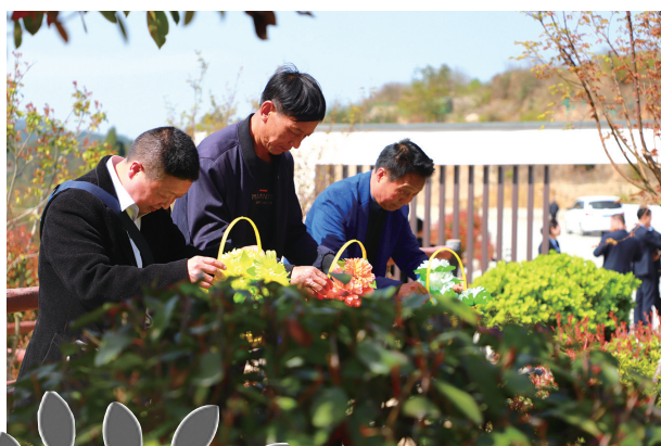
树葬仪式礼成,亲属们依次献花、鞠躬,和亲人作最后的告别。