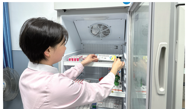
疫苗必须存放在2℃—8℃的医用冰箱内。