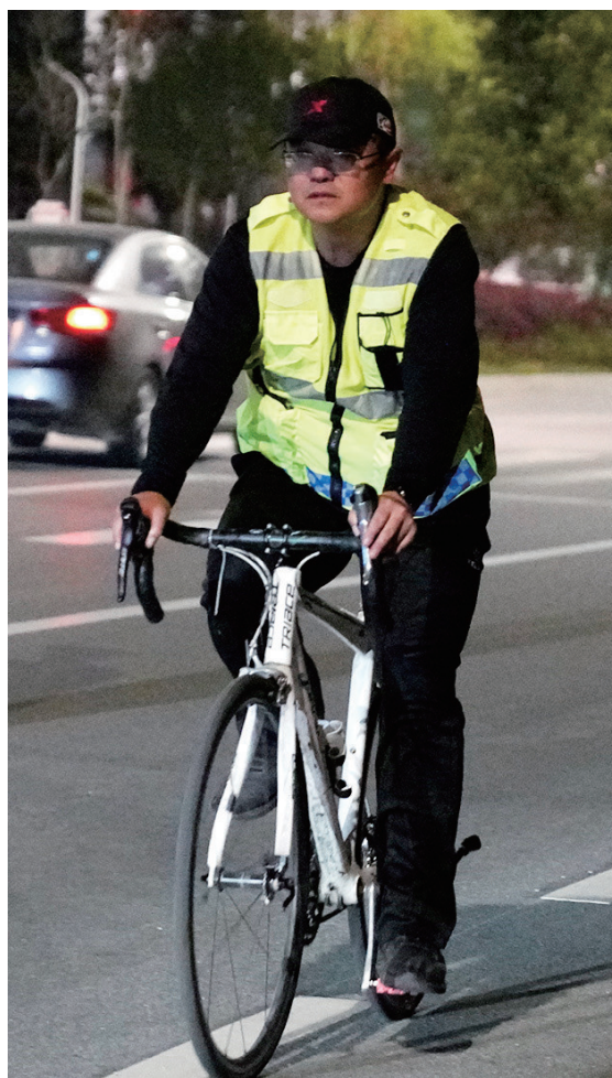
夜深人静时,就是续飞的最佳丈量时间。他穿上反光背心骑行7小时左右,完成一条全马赛道的丈量工作。