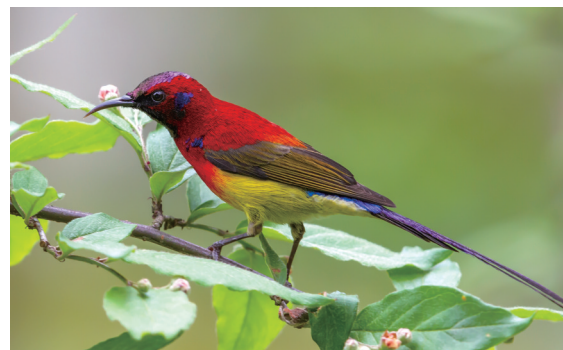
早春晴日自风度，岭树数声春鸟啼。 ——宋·葛绍体《春日即事二首》