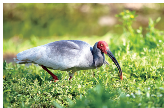
整翮辞炎服，乘春向帝畿。沉浮茄下食，容与藻中依。 ——清·纳兰性德《朱鹭》