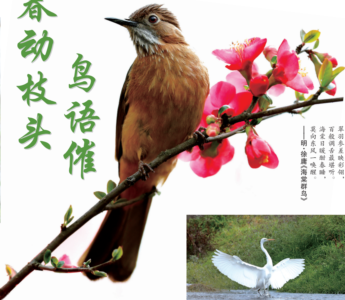
翠羽参差映彩翎， 百般调舌最堪听。 海棠日暖酣春睡， 莫向东风一唤醒。 ——明·徐庸《海棠群鸟》