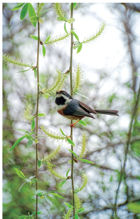
岸柳垂金线，雨晴莺百啭。 ——五代·顾夘《醉公子·岸柳垂金线》