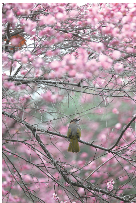
重华事往人何在，万古春深鸟自耘。 ——宋·林景熙《喜监簿得陶山舜田》