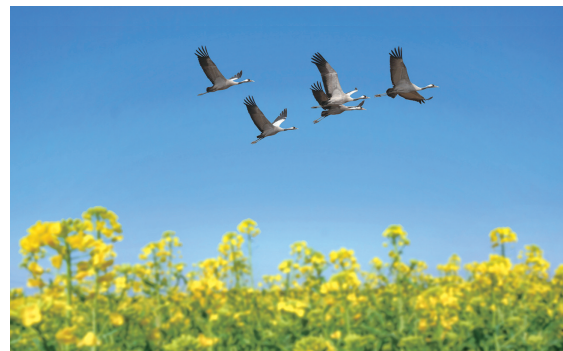
花鸟皆诗料，江山即画图。 ——宋·刘克庄《梦中为人跋画两绝》