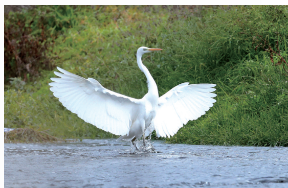
花开红树乱莺啼，草长平湖白鹭飞。 ——宋·徐元杰《湖上》