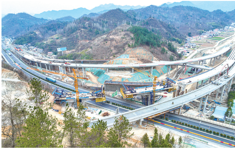
十巫北高速天河大桥主体完工,为明年全线建成通车奠定基础。