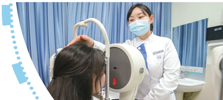
检眼师为患者做视力检查。