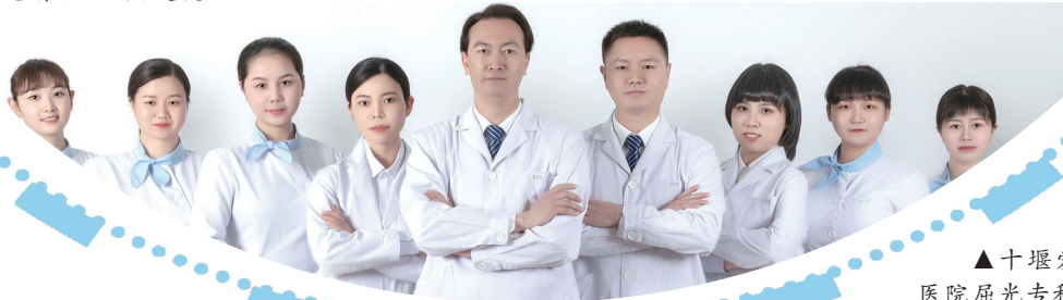
▲十堰爱尔眼科医院屈光专科团队。