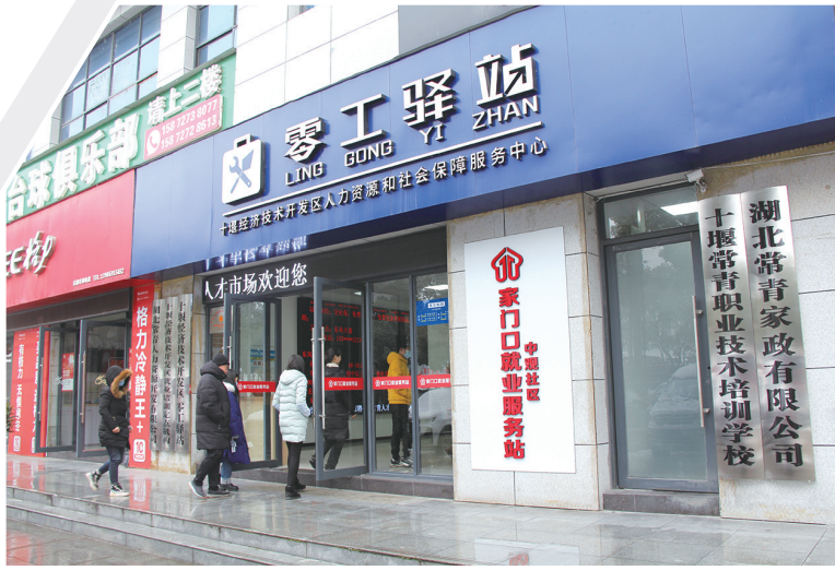
十堰经济技术开发区的中观社区零工驿站成为附近群众找工作的“联络站”。