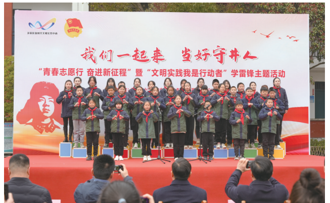
茅塔乡中心小学学生表演节目。

茅箭区新时代文明实践中心将联合相关部门,坚持围绕中心、服务大局,与推进流域综合治理、强县工程、乡村振兴、共同缔造等结合起来,发挥文明实践作用,为推动茅箭区高质量发展付诸实际行动。