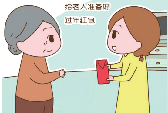
给老人准备好 过年红包

新春佳节刚过,不少老人晒出了孩子们送来的新潮拜年礼物。与之前过年送衣服鞋帽、保健品相比,如今大家更关注老人生活品质的提升、精神需求的满足。近日,记者采访了几位老人,他们分享了自己收到的新潮新年礼物。 ■记者 杨天娇