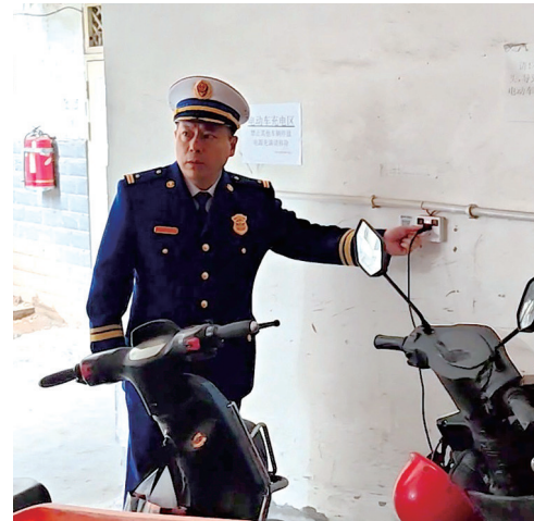
开展小区电动自行车充电桩安全检查。