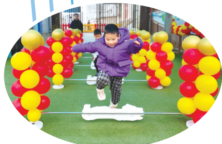
郧阳区南化塘镇中心小学幼儿园,小朋友蹦蹦跳跳入园。