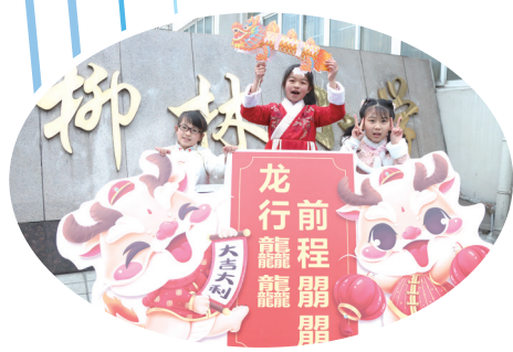
柳林小学的孩子们穿着汉服在校门口与卡通龙合影。

同时,十堰交警联合教育局持续开展“给家长一封信”“开学第一课”交通安全宣传活动,通过“送教上门”的形式,对不同年龄段、不同区域、不同学校的学生“因材施教”,全面强化学生交通安全意识和防范能力。为进一步净化校园环境,杜绝校园欺凌行为,营造和谐的育人氛围,促进学生身心健康发展。