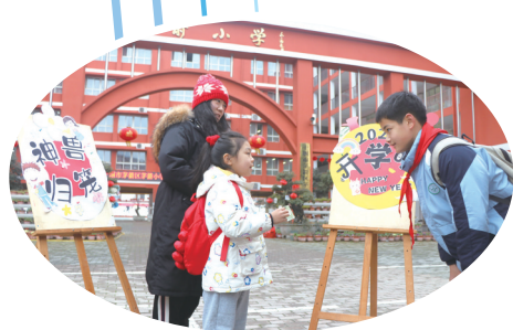
茅箭小学六年级大哥哥向一年级新生介绍“校园银行——劳动精灵币”用途。