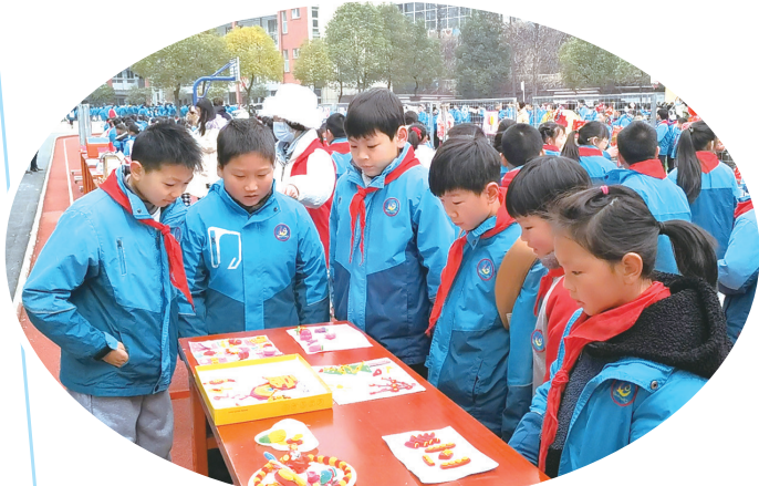
东风40学校学生利用大课间以游园的形式欣赏每个年级展出的特色作业。