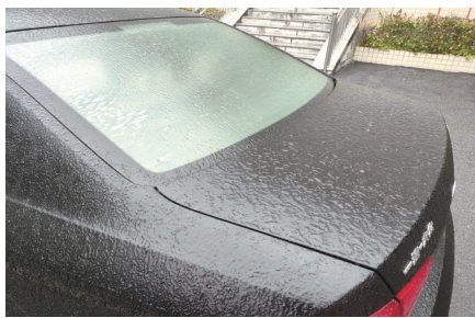
车上结冰后像抹了一层油。

上周,受北方强冷空气影响,我市出现了一次低温雨雪天气过程。既有轻盈飞舞的雪花,又有“盐里盐气”的雪籽,还有噼里啪啦的冰粒。那么,十堰上周到底下了些啥呢?记者采访了气象专家。