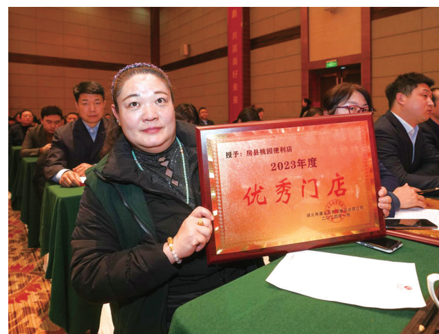
优秀门店代表展示牌匾。