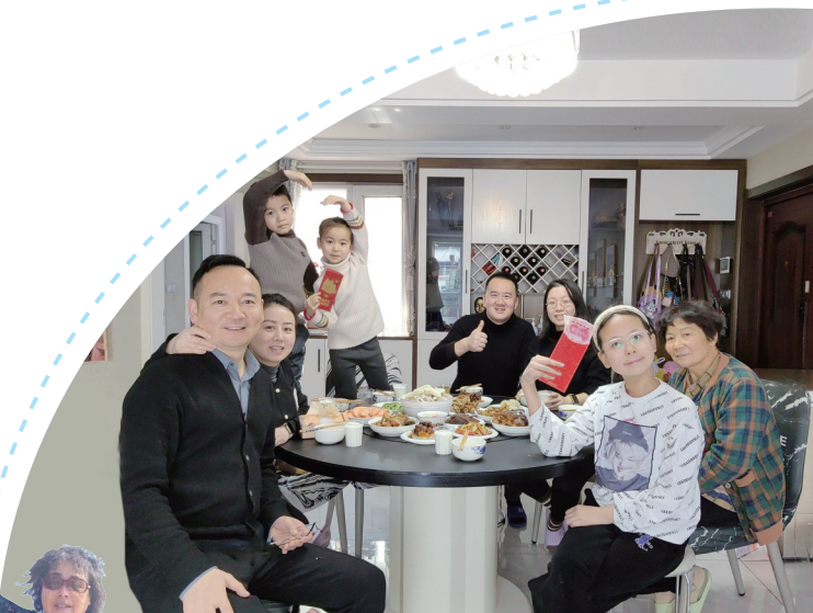
一家人聚在周大秀家里吃团年饭,十分热闹。