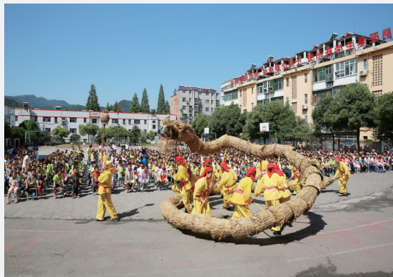
草把龙灯已成为十堰的代表性民俗节目之一。