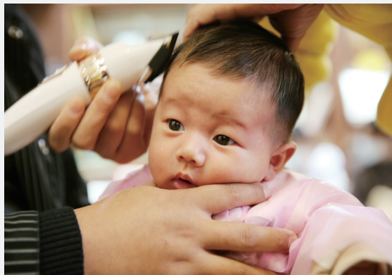
二月二“剃龙头”的习俗传承至今。