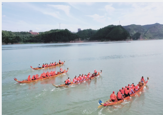
每年端午节,郧阳区都会举行汉江龙船会。