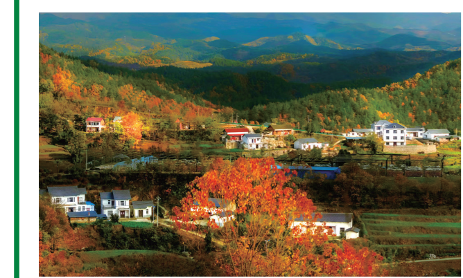
初秋时节,翻山堰村犹如一幅美丽的七彩油画。