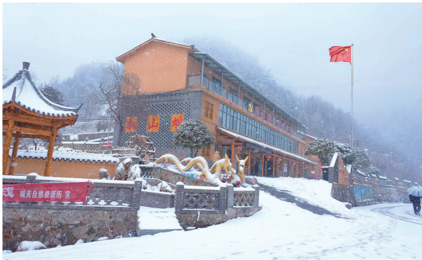
漫天大雪为古香古色的翻山堰村增添了冬日的别样韵味。