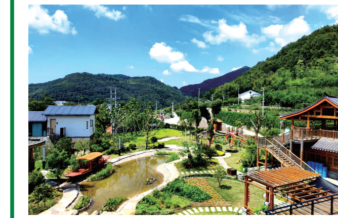
蓝天白云掩映着绿树环绕的山村。