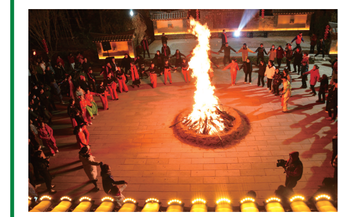
在2023年的首届村晚上,村民们围着篝火载歌载舞。