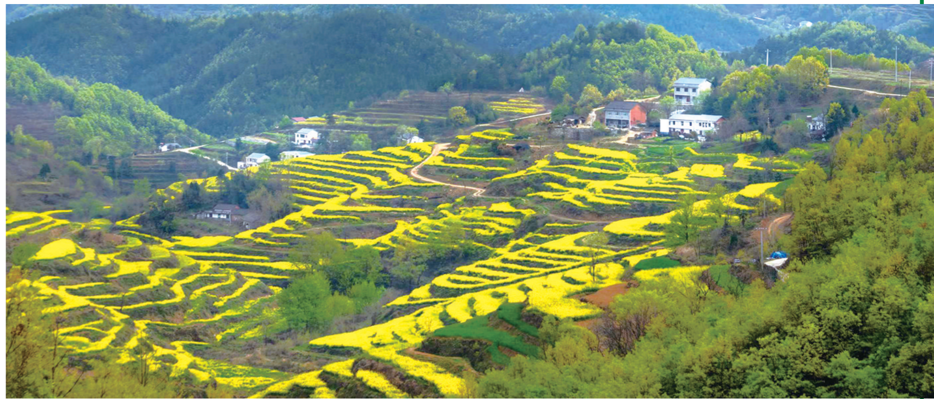
早春的油菜花海成了翻山堰村的知名景点。