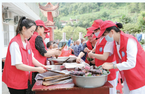
端午节,医院志愿者为福利院老人包爱心粽子。