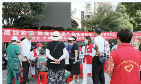
医院健康义诊活动走进兴丽城。