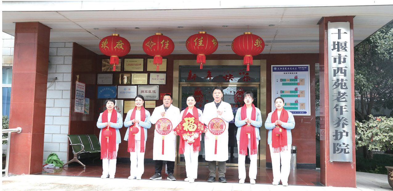
西苑老年养护院张灯结彩,营造节日氛围。

据了解,春节期间,西苑医院急诊科、内科、外科、妇产科、感染科、老年医学科等临床科室均安排医护人员值班,还配备了应急医护人员。一旦出现突发紧急情况,可以随时启动应急预案,保障应急救援。