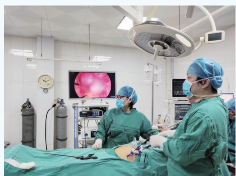
医院妇产科实施复杂腹腔镜手术,切口仅1厘米。