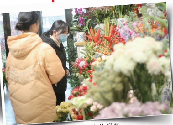
市民在花店里选年宵花。

阳台上自制的腊鱼、腊肠已挂出;带有龙年元素的对联、窗花已准备好;拆开快递,年货琳琅满目……所有的这一切都预示着,一年中最重要的节日——春节即将隆重登场。忙着打年货的老年朋友们,龙年春节都准备了啥年货?一起来听听他们分享的故事吧。