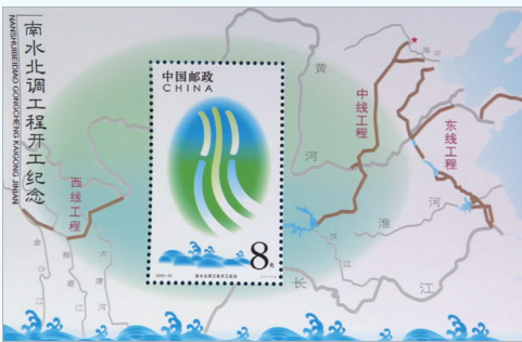
《南水北调工程开工纪念》邮票纪念意义非凡。