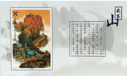
《武当山》邮票形象展示了武当风貌。