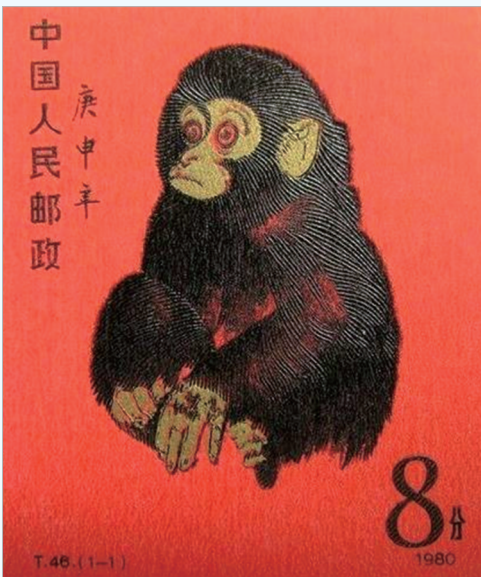
《庚申年》邮票弥足珍贵。