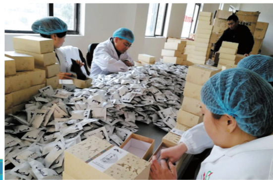
湖北武当生物医药科技有限公司工人起制生产武当丹茶。