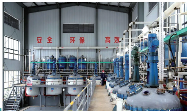
竹溪县医药化工产业园内现代化的药品生产车间。