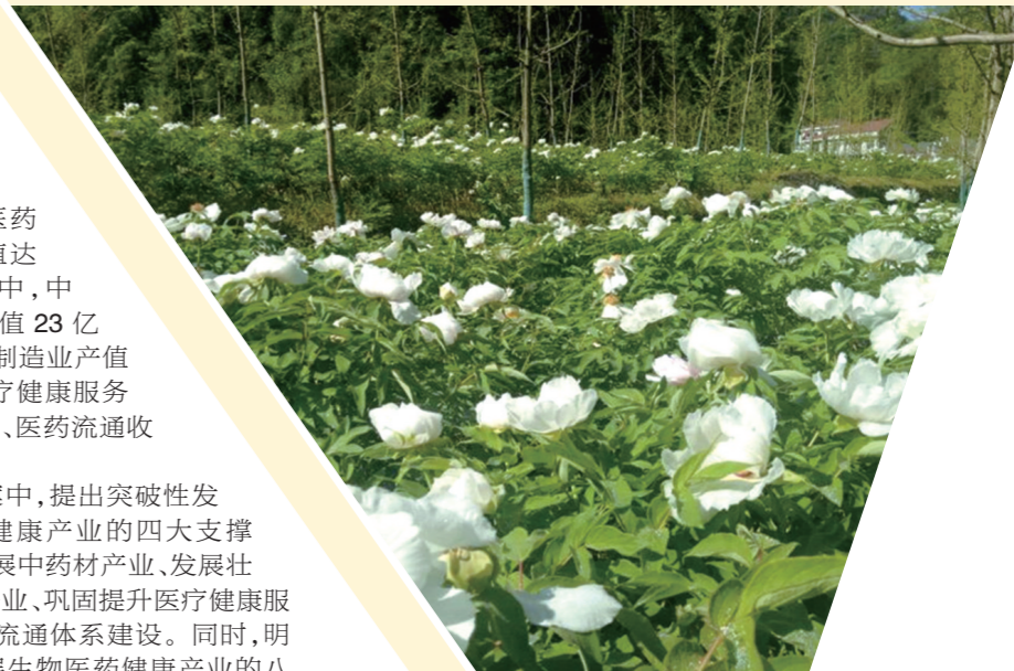
竹溪县推广中药材芍药种植技术,取得成效。