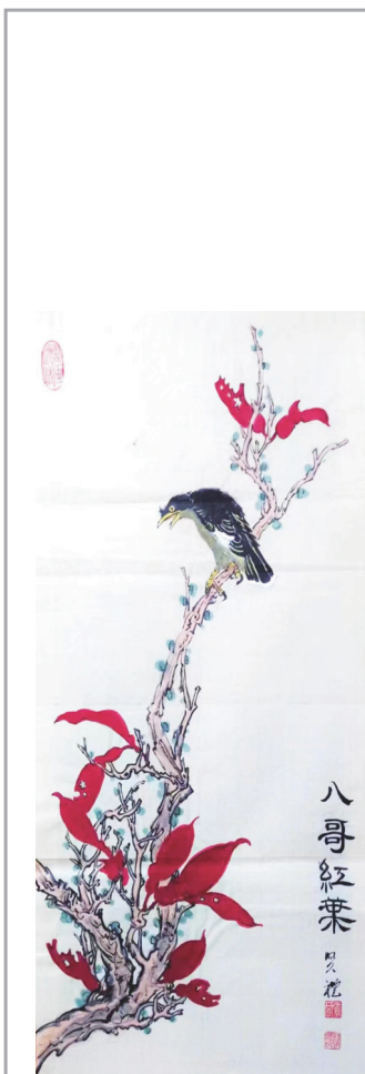
国画:《八哥紅葉》作者:賈賢禮