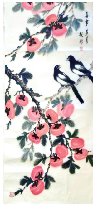
国画:《喜事多多》作者:何从新