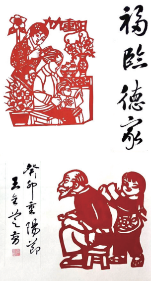
剪纸:《福临德家》作者:王全芝