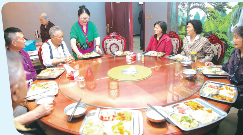
三堰社区幸福食堂里欢声笑语不断。(资料图片)