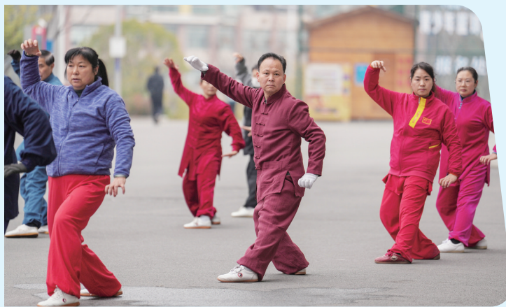
老年大学根据老人的学习需求,开设太极拳等课程。(资料图片)