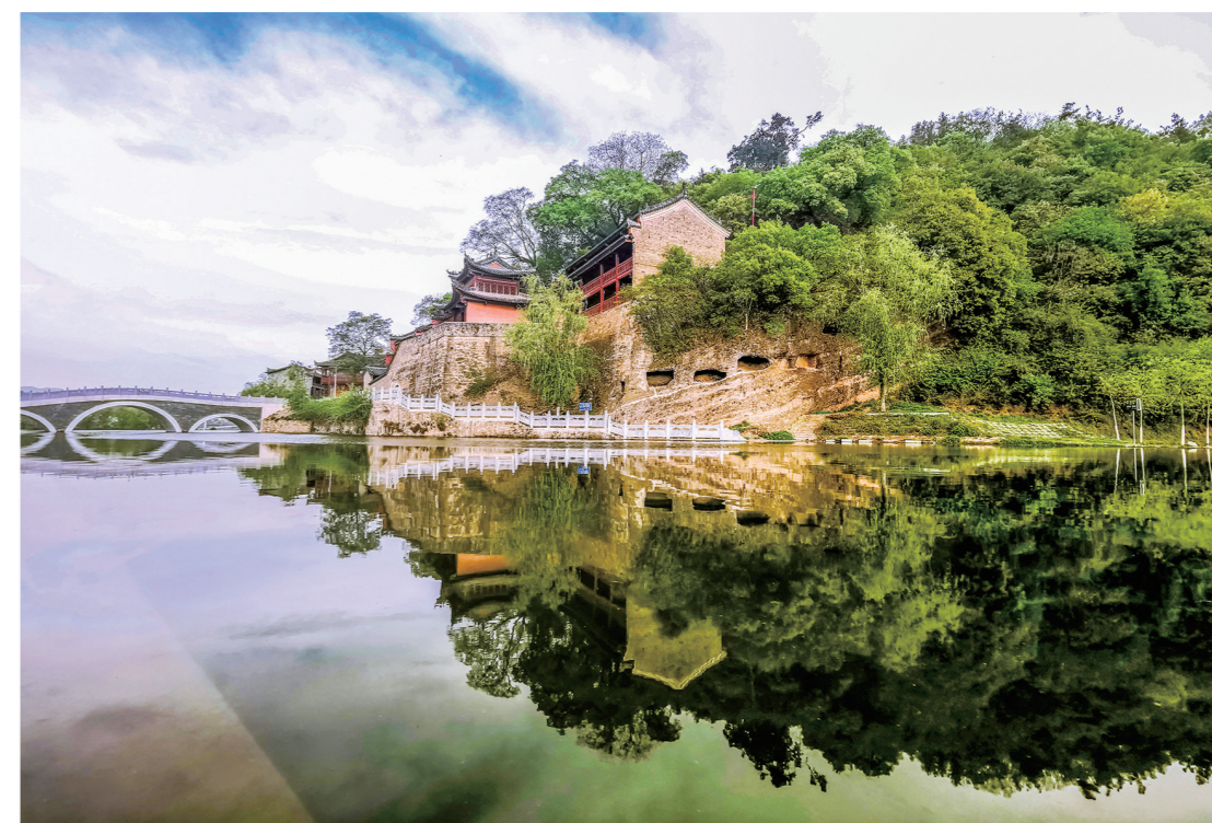
位于房县军店镇房山脚下的显圣殿景区依山傍水,景色秀丽。