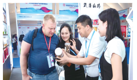
十堰食用菌联盟亮相淄博国际香菇展。