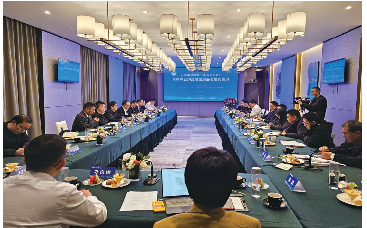
十堰产投集团举办十堰市企业家沙龙系列活动。