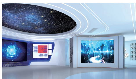
十堰(深圳)离岸科创中心展厅。