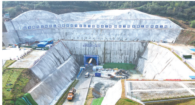
引江补汉输水总干线出口段主隧洞施工现场,建设者加紧施工。