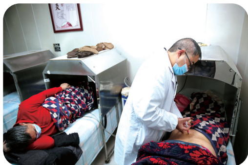
特色诊疗技术为患者解除病痛。

“医”心为民,守护健康。铁三处社区卫生服务中心始终关注社区居民的健康需求,彰显医者的初心使命和责任担当,用情用心打通服务健康的“最后一公里”。未来,该中心将进一步提升基层医疗设施和能力建设,以高品质服务守护好社区居民身体健康。