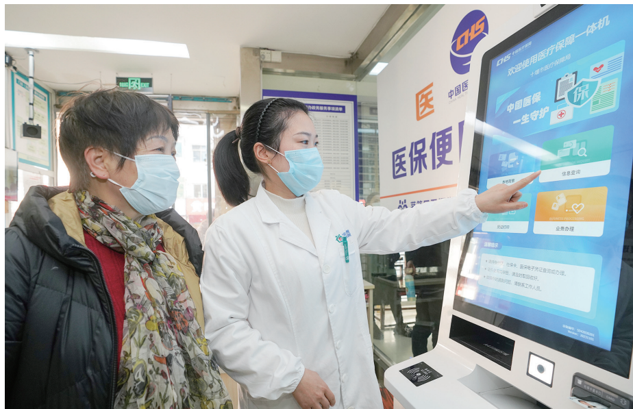
便民设施一应俱全。