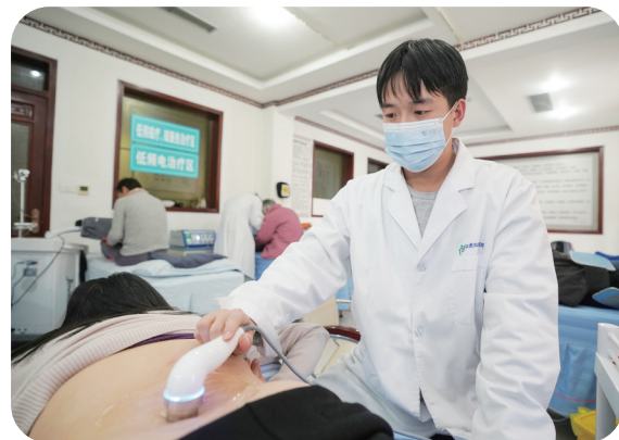
超声波治疗已成为常态。