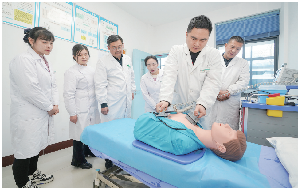
鸳鸯乡卫生院积极创建2023年基层心脑血管疾病一体化防治站,极大提升急诊急救服务能力。