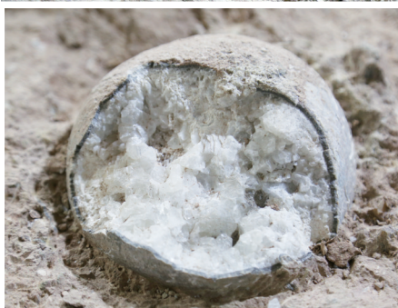
编号为J2的结晶恐龙蛋化石。