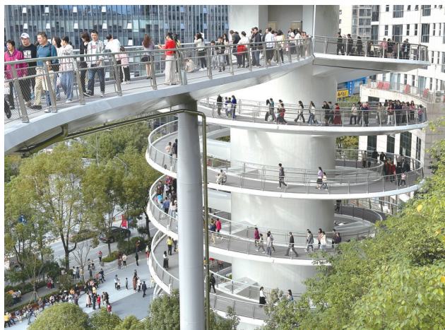
健康步道游人如织。(资料图片)