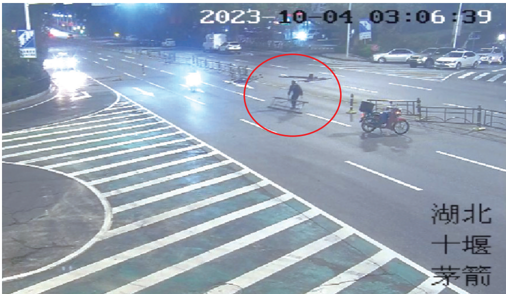
摩托车手主动将散落的护栏捡拾到安全地带,消除了安全隐患。