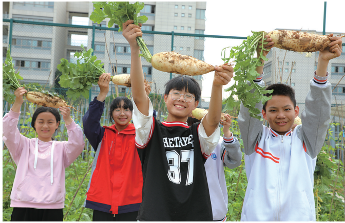
学生展示自己丰收的成果。