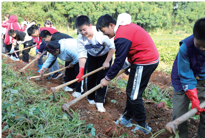
学生们开心挖红薯。