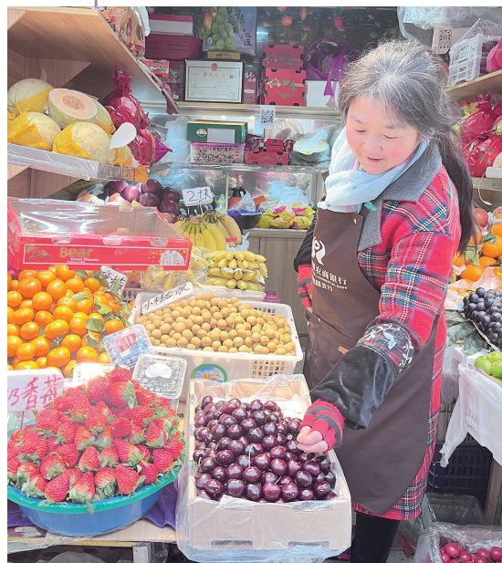
今冬首批进口车厘子登陆东岳市场,4J等级的售价为每斤130元。