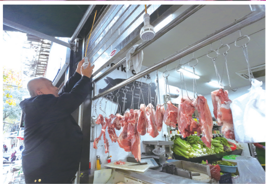
“生鲜灯”当场被换上普通照明灯具。