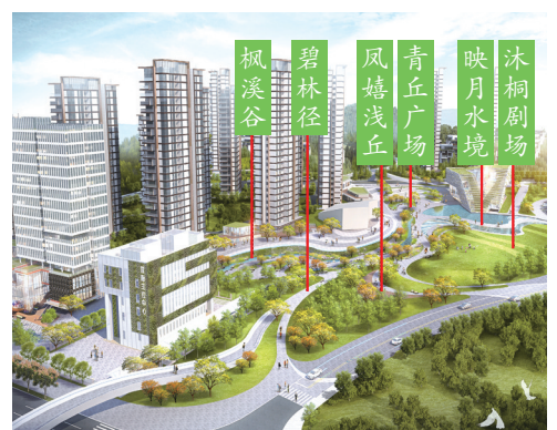
凤栖绿谷(一期)初步效果图。

记者了解到,中央商务活力区已开工太和医院七里坪院区、厦门路、新高中、幸福路(二期)、山东路(厦门路段)、厦门路学校、凤栖绿谷等多个项目。目前,太和医院七里坪院区(一期)土建已完工、厦门路路基全面贯通。