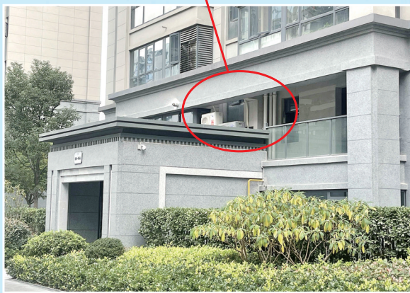
柯先生将空调外机装在单元门上方的平台上。