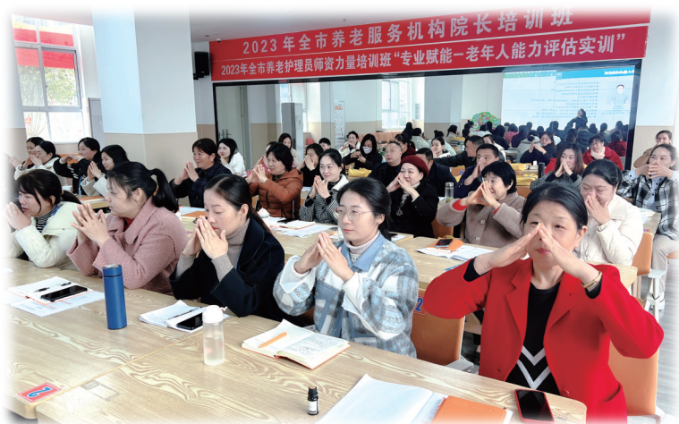
学员们不仅学习护理知识,还接受了老年心理培训。

近日,全市养老护理员师资力量培训班、养老机构院长培训班开课,来自全市各个养老机构的100多名护理员、院长通过培训,将进一步提升从事养老护理的职业素养、专业水平和服务质量。