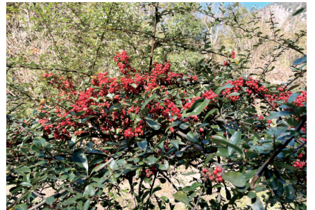
峡谷内的火棘挂果，明艳似火。

站在石门入口处抬头望，两山对垒，令人晕眩。几乎垂直的峭壁高耸入云，峡谷中林深树密，惟见云朵飘浮的一线青天；低头看，两旁藤萝密布、瀑鸣潭幽，一条山溪奔腾咆哮，撞击在巨大的岩石上发出隆隆的响声，震耳欲聋。