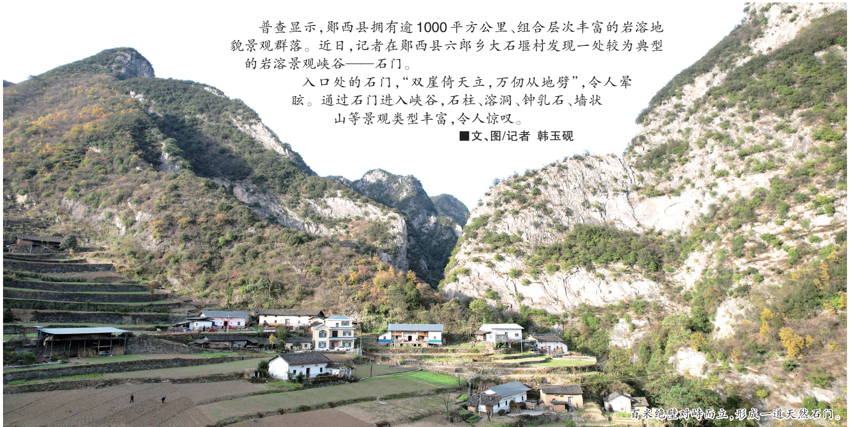
百米绝壁对峙而立，形成一道天然石门。